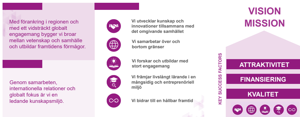
Figur 3. JU:s mission, vision och strategi 2020–2025.

Ett förtydligande av kvalitet som en central komponent i JU:s strategi har gjorts i samband med strategiarbetet vid JU under 2019/2020. Stiftelsestyrelsen fastställde JU:s reviderade vision, mission och strategier i maj, 2019. I den nya strategin har tre ”key success factors” specificerats vilka är viktiga förutsättningar för att JU ska kunna genomföra de fastställda strategierna i arbetet mot JU:s mission och vision. De tre definierade ”key success factors” är attraktivitet, finansiering och kvalitet, se Figur 3.