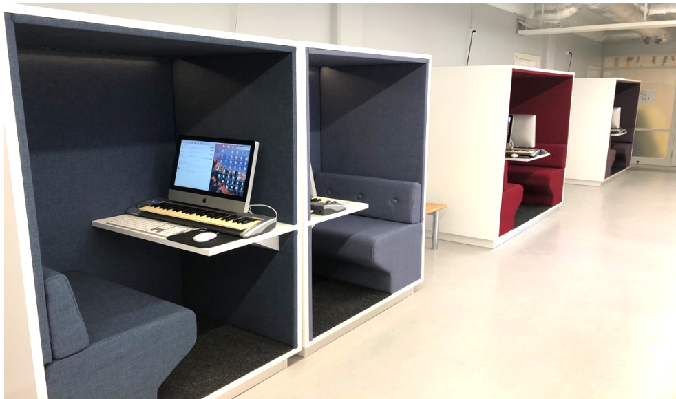
Arbetsstationer för musik och teknik

Pedagogiska metoder och verktyg som förutsätter att det finns stöd och tillgång till modern informations- och kommunikationsteknologi (IKT) används i undervisningen. Genom samarbete med musik- och media utbildningsföretaget Be-Licensed har SMI:s datorsal tretton arbetsstationer med det senaste i hård- och mjukvara för musik, samt ackrediterad kompetens för undervisning i digitala musik- och mediaplattformar. Därtill finns ytterligare åtta stationer på SMI för studenter att kunna arbeta enskilt eller i par med eget arbete: