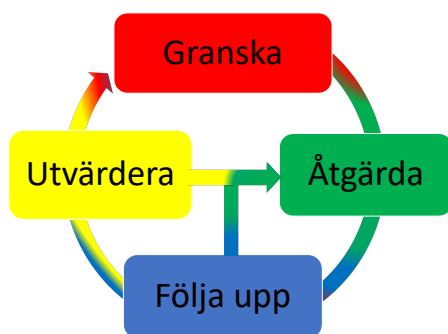
Figur 3. Cykel för behandling av ärenden i kvalitetssäkringsarbete vid SMI. Färgkodningen följer Tidsplan för kvalitetssäkringsarbetet vid SMI 2018-2028 (Bilaga 5).

Utifrån högskolans kvalitetspolicy ska utbildningarna vid högskolan granskas i sexårscykler [KP 1.1.1, 1.9, 1.10]. Granskningen görs av FUN och kompletteras vart sjätte år med en extern granskning av högskolans verksamhet i samverkan med SH. Den första externa granskningen sker 2023 och går omlott med granskningen vart sjätte år av Universitetskanslersämbetet (UKÄ), där granskning ska genomföras 2020. De förbättrings- och utvecklingsområden som identifieras resulterar i vidtagna åtgärder och att nya mål formuleras. Modellen visualiseras utifrån cykel för behandling av ärenden i kvalitetssäkringsarbete vid SMI (Figur 3).