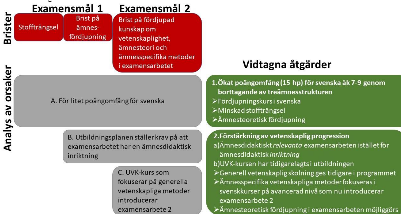
Figur 1 Analys av orsaker till påtalade brister och sammanfattning av vidtagna åtgärder

I figur 1 sammanfattas LiUs analys av orsaker till de påtalade bristerna samt vilka åtgärder som vidtagits.