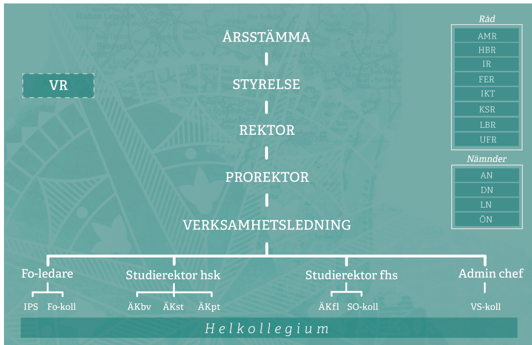
Fig. 1 Organisationsschema

Förkortningar: VR - Verksamhetsråd, Fo-ledare - Forskningsledare, IPS - Institutet för Pentekostala Studier, Fo-koll - Forskningskollegium, ÅKbv - Ämneskollegium Bibelvetenskap, ÅKst - Ämneskollegium Systematisk teologi, Ämneskollegium Praktisk teologi med kyrkohistoria, ÅKfl - Ämneskollegium Församlingsledarkurser, SO-koll - Samordnarkollegium, VS-koll - Kollegium för verksamhetsstöd, AMR - Arbetsmiljöråd, AN - Antagningsnämnd, DN - Disciplinnämnd, FER - Forskningsetiskt råd, HBR - Hållbarhetsråd, IKT - Råd för Informations- och kommunikationsteknologi, IR - Internationaliseringsråd, KSR - Kvalitetssäkringsråd, LBR - Likabehandlingsråd, LN - Lärarförslagsnämnd, UFR - Utbildnings- och forskningsråd, ÖN - Överklagandenämnd