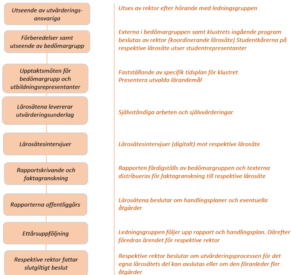
Figur 2. Utvärderingsprocessen på grundnivå och avancerad nivå.

Utvärderingsprocessen av forskarutbildning sker enligt liknande principer som för utbildningsutvärderingar på grundnivå och avancerad nivå. Utvärdering av forskarutbildning sker dock inte inom ramen för Treklövermodellen. Karlstads universitet har valt att arbeta lärosätesinternt med dessa granskningar men med extern representation i bedömargruppen. Regelbunden och återkommande kvalitetssäkringsgranskning på forskarutbildningsnivå genomförs klustervis med en genomförandetid på nio månader (se Figur 3). Under utvärderingsprocessens första tre månader tar berörda forskarutbildningsämnen med hjälp av den grupp av administrativa stödfunktioner som knyts till arbetet (stödgrupp) fram självvärderingsrapporter enligt skriftliga anvisningar. Samtidigt tillsätts en bedömargrupp för varje kluster som ska utvärderas. De kommande tre månaderna inleds med en träff för bedömargruppen där de får utvärderingsunderlaget och kan påbörja sitt arbete. Bedömargruppen kan begära kompletterande material av de utvärderade forskarutbildningsämnena, och efter senast tre månaders arbete genomför bedömargruppen intervjuer och startar rapportskrivningsprocessen. Bedömarrapporten överlämnas till rektor efter ytterligare tre månader för att därefter offentliggöras. Sedan